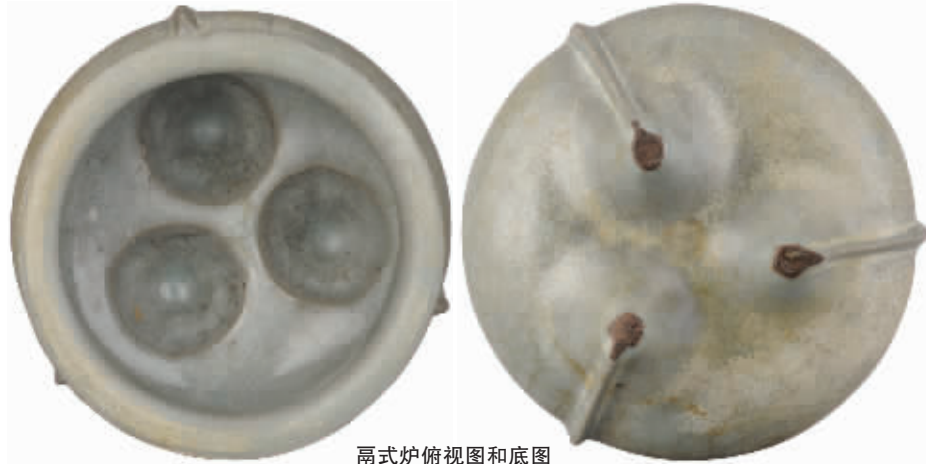
鬲式炉俯视图和底图

宋代瓷器有著名的“汝、官、哥、定、钧”五大名窑,而其中最为珍贵的首推汝窑瓷器。汝瓷以其绝美的天青色而为世人称道,另外很大一部分汝窑瓷器烧造时,窑内温度略低于正烧温度,一般称之为“生烧”,这使得它们的釉面局部会呈现青灰色以及米黄色的斑点,同时汝瓷釉面也布满自然天成的开片纹理,又称为“冰裂纹”,这些共同让汝瓷更具神秘的美感。而这件南宋龙泉窑青釉鬲式炉与汝瓷有异曲同工之美,其釉面的开片,釉色青中闪米黄的斑驳,让人领略瓷釉的变幻莫测,这或许才是古瓷最大的魅力所在。