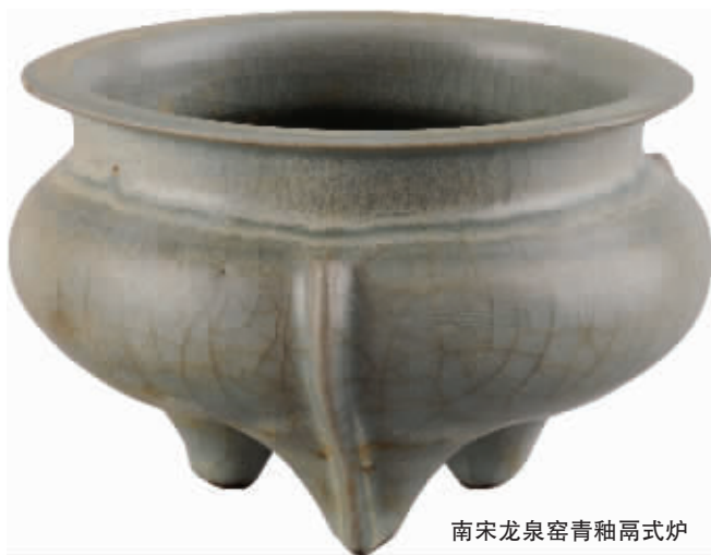
南宋龙泉窑青釉鬲式炉

中国人对香的使用,至少有四千年以上的历史。古人在祭祀、礼佛、文房陈设中都会使用到各式精巧的香具,比如汉代人使用的博山炉,明清时期的宣德炉,都非常经典。而鬲式炉则是南宋时期一种经典的香具造型。所谓“鬲式炉”,是一种仿商周青铜鬲造型的香炉。鬲是商周青铜器中一种常见的器型,原先的用途是炊粥器,起初造型最大特点就是足空与器腹相通,也称为袋状足或袋形腹,以增加腹部的容量和扩大受火面积,便于较快地煮熟食物。宋代是一个好古之风兴盛的时代,北宋中晚期以后,皇室与士大夫皆热衷于古物收藏,比如宋徽宗赵佶就曾组织人员编写《宣和博古图录》,欧阳修撰有