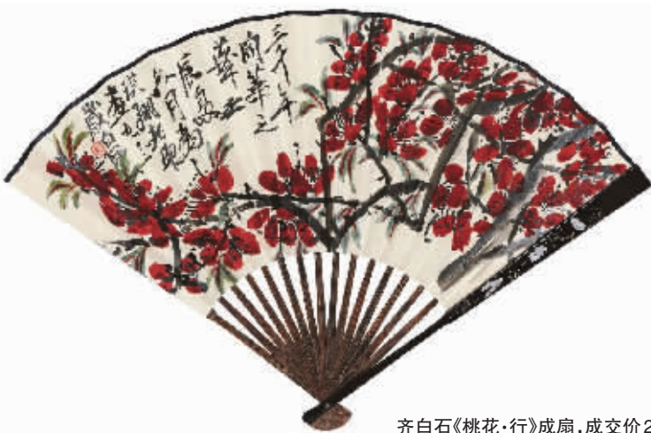
齐白石《桃花·行》成扇,成交价241.5万元,北京保利2018秋拍