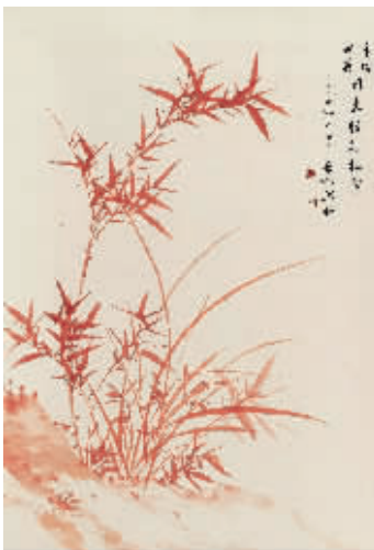
启功《朱砂兰竹图》,成交价115万元,北京荣宝2018秋拍

本报讯 2018年中国艺术品拍卖已逐步落下帷幕,虽说也取得不小的成绩,但总体来说,2018年拍卖市场的热度远不如行情火爆的2017年秋拍,各拍卖行拍品质量参差不齐,市场整体拍卖价不高,艺术品总成交额明显萎缩,且市场流拍现象也较严重。