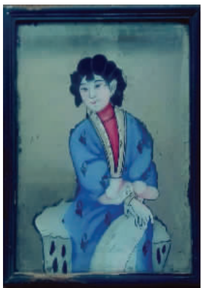
图1 民国仕女玻璃挂镜

我国在明清之际出现了最早的玻璃镜子,它是由来华的传教士从欧洲带来的。最初是供皇宫、王爷京官享用的艺术品,到了嘉道年间玻璃镜逐渐走向民间。而从民国到上世纪六七十年代,玻璃镜发展到了顶峰。在玻璃镜子上画画,一个是其正面用油彩、水粉、