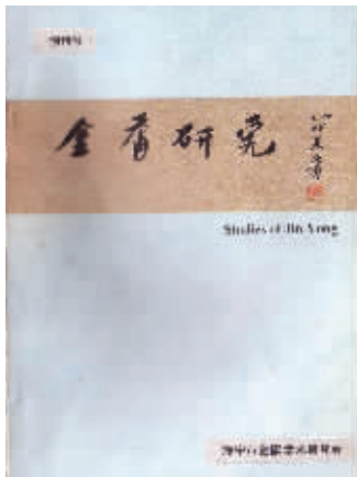
图1 《金庸研究》创刊号封面