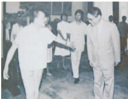
图4 1981年7月18日邓小平会见金庸的照片