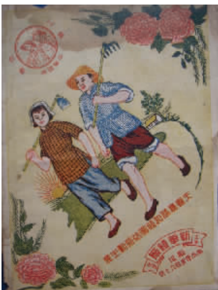
图2 蝶恋花小摆镜背面宣传《婚姻法》

国画颜料等绘制的图画,我们称为玻璃画,一个是在其反面印着制作单位,纸质装饰画。上世纪六七十年代,玻璃镜成了最时髦的生活用品,乔迁搬家、新婚贺喜、馈赠送礼,送一印印有祝福感谢话语的玻璃镜,既能表达美好的祝愿,又显得高雅大方。