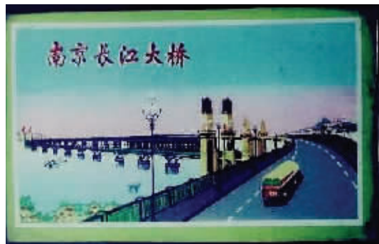
图3 “南京长江大桥”挂镜

随着改革开放的发展,生活水平的提高,人们的居住条件得到了改善,从土木结构的平房,搬进了钢筋水泥结构的楼房,小小的玻璃镜与宽敞高大的房间不协调,被大尺寸的水银镜或大幅的风景画所替代。上世纪80年代中期,玻璃镜逐渐退出历史舞台。但对经历过那个时代的人来讲,玻璃镜是其美好的记忆,一面玻璃镜,就是一段故事,就是一个承载回忆的历史见证。