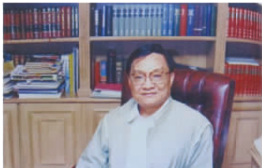
图3 金庸在书房的留影

2018年10月30日,金庸先生在香港去世,享年94岁。这位影响了几代中国人阅读体验的武侠小说宗师,一生创作了14部脍炙人口的长篇小说,在中文世界可谓家喻户晓。一时间,大家都在谈论着那些年阅读“金大侠”作品的美好记忆。我想起自家书房里不仅收藏了全套金庸小