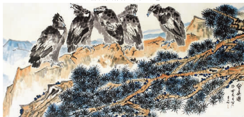
李苦禅《会英图》,成交价3910万元(2012年秋拍)

七年之后的北京2010年春秋两季大拍,正值最新一轮的收藏热潮启幕之时,这一年可以说是李苦禅作品在拍卖市场