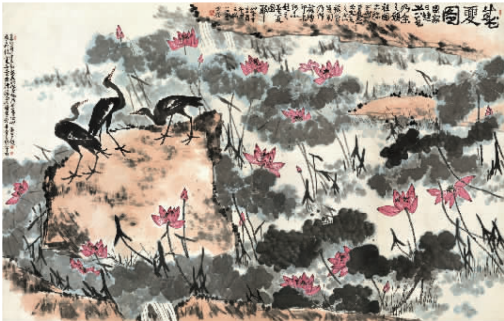
李苦禅创作的篇幅最大的大写意花鸟画《盛夏图》(1981年作),纵368、横580厘米

11月21日,“法古禅心——纪念李苦禅诞辰120周年艺术展”亮相中国国家博物馆,展出李苦禅精品力作一百余幅。本次展览由国博与山东省委宣传部、中国美术家协会、中央美术学院、山东省文联共同主办,展期持续到12月22日。