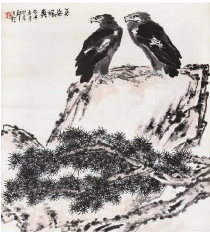
李苦禅《英姿飒爽》立轴,成交价1120万元(2010年秋拍)

在李苦禅诞辰120周年之际,在苦禅家属及李苦禅纪念馆等单位支持配合下,国家博物馆系统梳理李苦禅艺术探索历程,精心策划了此次展览。李苦禅一生勤勉谦逊,展出的百余件不同时期精品力作可为明证;与艺坛宗师齐白石和徐悲鸿的师友情谊,从往来信札中可见一斑;始终如一的问学问道精神,使得论画手稿更显弥足珍贵。经历颠沛流离依然保存完好的学生作品,去世前几小时的书法日课习作,以及不胜枚举的体现李苦禅高逸风骨的作品、实物等,都使观者深为