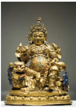
图3 清代铜鎏金财宝天王像