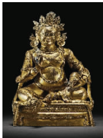
图5 清乾隆铜鎏金黄财神像