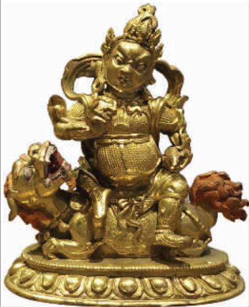
图1-1 铜鎏金财宝天王像正面图