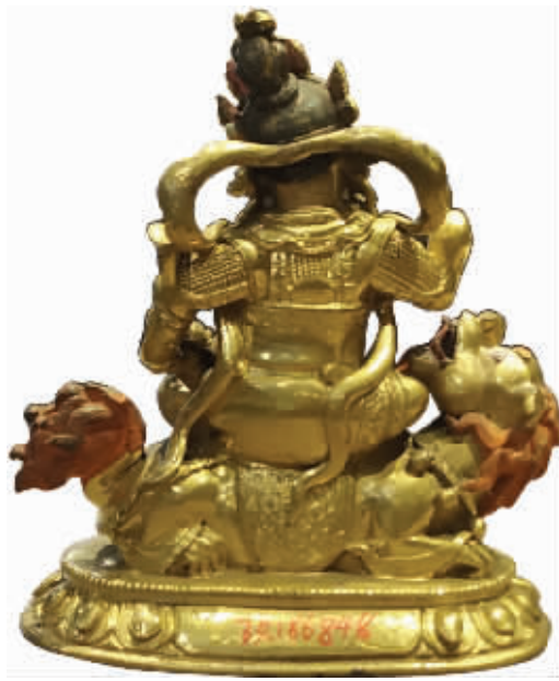
图1-2 铜鎏金财宝天王像背面图

财宝天王是众财神的首领,又名多闻天王、毗沙门天,北方的保护神,是佛教四大天王之一。财宝天王又兼司财之职,梵文称kuber,意为施财天,是掌管财宝富贵、护持佛法的善神。多闻尊天王是据于须弥山天中北方的守护大神,与东方的持国尊天王、南方的增长尊天王、西方的广目尊天王并称“四大尊天王”。