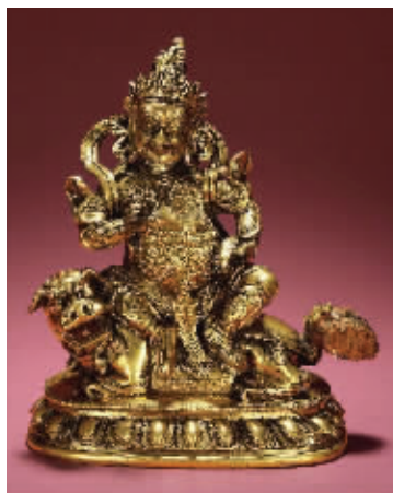
图2 十九世纪铜鎏金财宝天王像