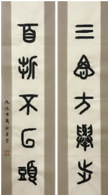
篆书对联: 三思方举步,百折不回头