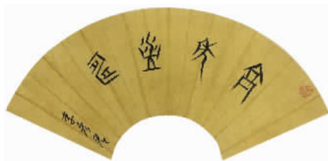
甲骨文扇面:高年益寿