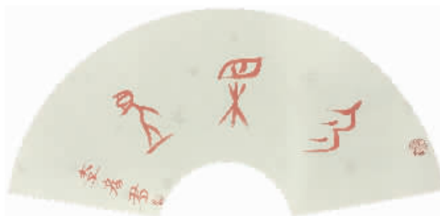
甲骨文扇面:勿相忘