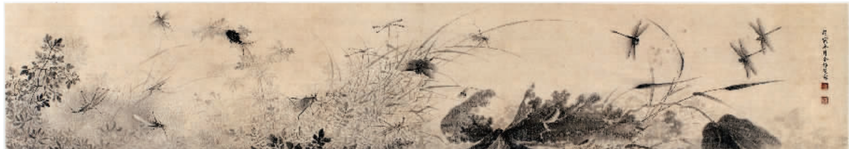
美国大都会艺术博物馆藏余静芝《草虫图》卷