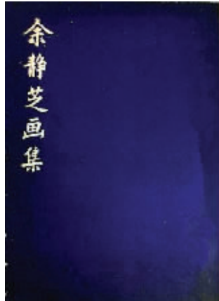
《余静芝画集》第三、四集,1967年印于美国纽约