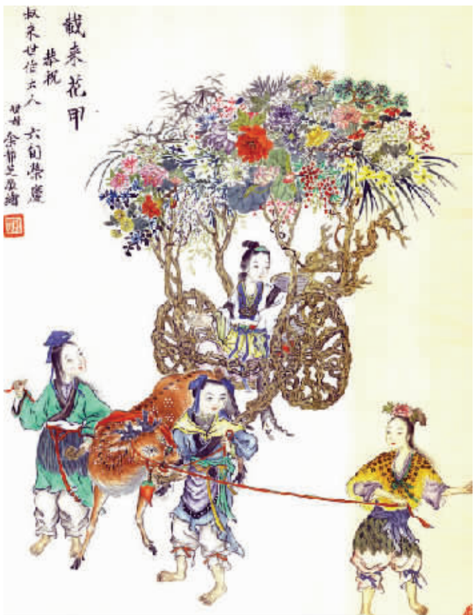
余静芝1944年绘《载来花甲》

遗憾的是,这样的“新女范”,如今却知者无多,闻者寥寥,其确切的生卒年至今还不十分清楚。这样的现象,不禁令人感慨万千。