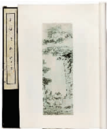
《余静芝画集》第一、二集,1936年印于中国上海