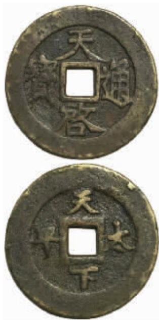
明天启通宝背天下太平大钱,原钱陈鸣供图,马定祥拓图