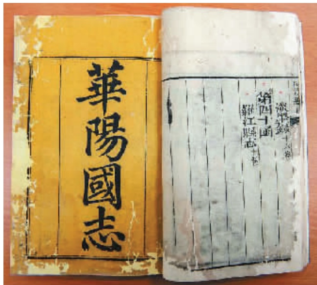
《函海》中的《华阳国志》

四川省绵阳市安州区图书馆。这个有90余年历史的区县图书馆，几经搬迁，却保存下不少珍贵的古籍文献。如今馆藏古籍文献共有近3万册，其中，包括清代蜀中才子李调元编辑刊刻的综合性丛书《函海》。2013年4月，这套160册的《函海》完成了抢救性修复，如今可对外提供阅览服务。这套丛书，包括大量蜀人的著述，其中不乏十分稀见的文献。