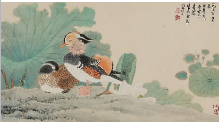
谢稚柳陈佩秋 1958 年作《鸳鸯嘉藕图》，成交价 437 万元，北京保利 2013 春拍