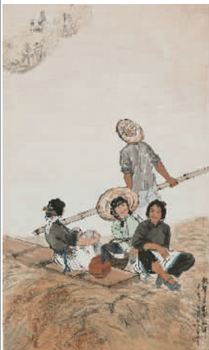
金志远徐熾 1962 年合作《歌声荡漾稻归》，中国美术馆藏