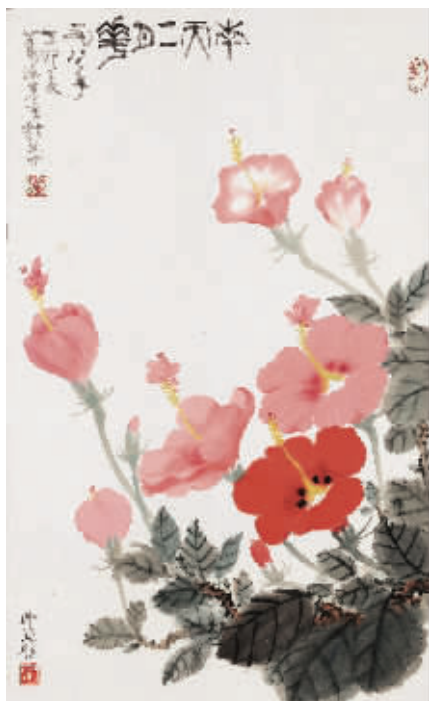
萧淑芳吴作人 1987 年合作《南天二月花》，成交价 33.35 万元，北京保利 2018 春拍

近日，在中国美术馆举办的一系列美术作品展览中，接连推出了两场书画家伉俪作品展——“江山如画——金志远、徐熾伉俪艺术展”与“执手同道——吴作人、萧淑芳合展”，博得不少关注的目光，同时也引发业界对于夫妻书画家合绘作品市场价值的探讨。