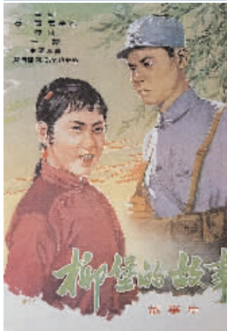
寇洪烈《柳堡的故事》

总之，在新中国手绘海报创作中，寇洪烈是不能缺席的，他创作的多款海报，见证了八一电影制片厂曾经的辉煌，同时定将会被后人永远记住。