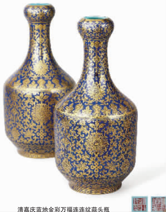
清嘉庆蓝地金彩万福连连纹蒜头瓶

当然,无论是艺术拍卖市场还是艺术产业的发展,都离不开对人民生活需求的把握。黄小坚表示,希望艺术品从业者在新的环境下牢记服务人民美好生活的宗旨,紧紧抓住艺术品消费带来的机遇,充分运用科学技术带来的便利,创新发展方式,捕捉国际化进程所带来的资源,寻找有效的发展途径,为探索一个全新艺术品市场发展模式,为服务国家社会经济承担更加积极的责任。(周洋)