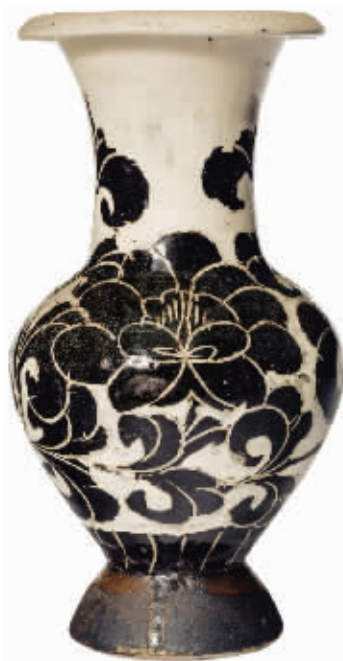
北宋磁州窑黑剔花牡丹纹瓶,估价6万—8万美元

记者注意到,本场拍卖提供的所有41件拍品中,最高估价为15万美元,而最低估价只有2500美元。路先生认为,这在一定程度上源于,在当今市场上的磁州窑拍品的价值认定还处于一个相对宽泛的区间——特别好的精品特别贵,而一般品种就比较便宜,价格区间往往从几百万元到几万元(人民币)的都有。而此次拍卖结果究竟怎样,让我们拭目以待。(记者 王国良)