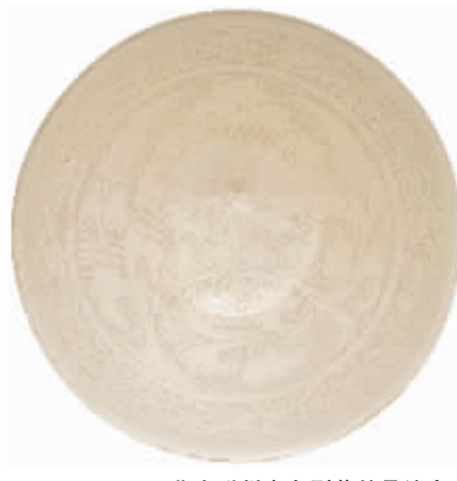
北宋磁州窑白剔花牡丹纹大碗,估价1.8万—2.5万美元