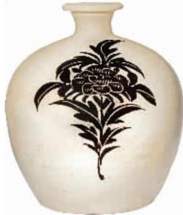
北宋一金磁州窑白地黑花牡丹纹小口瓶,估价6万—8万美元