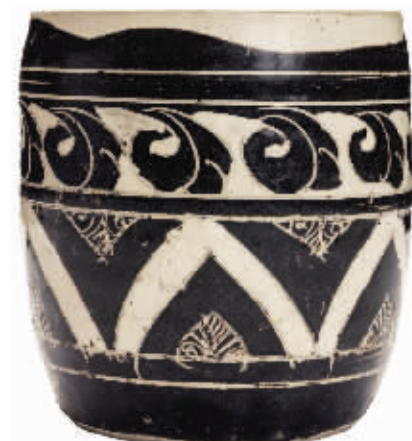
金磁州窑黑剔花几何纹罐,估价10万—15万美元