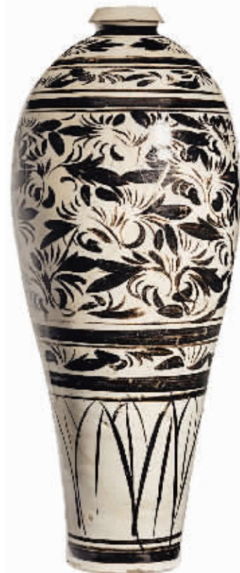
金磁州窑白地黑花花卉纹梅瓶,估价6000—8000美元