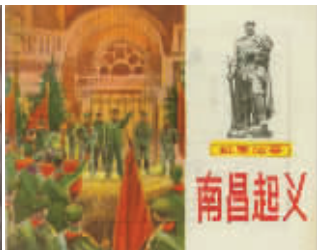
图2 人民美术出版社《南昌起义》