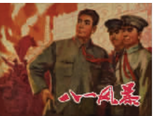
图4 江苏人民出版社《八一风暴》