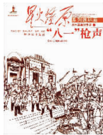
图8 解放军出版社《“八一”枪声》