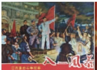
图3 江西人民出版社《八一风暴》

这几本连环画,从不同角度再现了八一南昌起义前前后后的风云变幻,塑造了周恩来、贺龙、叶挺、朱德、刘伯承等老一辈革命家的光辉形象。收藏这些连环画,不仅能享受收藏之乐,还能重温那段难忘的历史,从中受到教育。