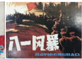
图7 人民美术出版社《八一风暴》