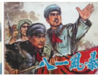
图6 辽宁美术出版社《八一风暴》