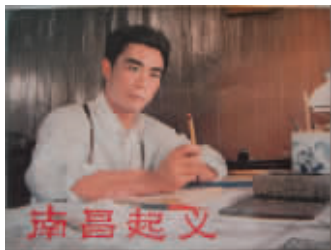
图1 上海人民美术出版社《南昌起义》