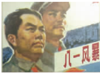
图5 浙江人民美术出版社《八一风暴》