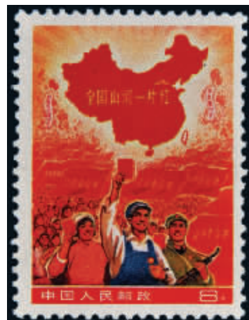
全国山河一片红(撤销发行)邮票一枚,成交价115万元(中国嘉德2018春拍)