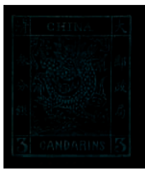
3分面值的大龙邮票