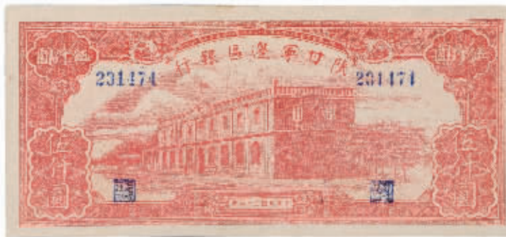
民国三十二年陕甘宁边区银行边币边区银行大楼图伍仟圆,成交价50.6万元

很大的信心。今年春拍火爆的邮币竞买现场,再次向人们证明,邮币收藏品的春天并未完全逝去,目前邮币虽然很不景气,但真正高端的好品种,依然还有市场,行情仍然看好。