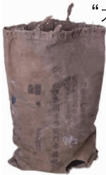
清代海关邮政时期邮袋

7月24日,“龙行华夏 国脉传承——大龙邮票诞生140周年文物珍品巡展”在天津启动,并于8月4日—7日亮相