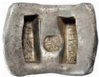
清代云南“学正堂张足色俸银”十两大长槽锭,成交价109.25万元

166.75万元成交,并打破了中国嘉德2017年春拍中创造的143.75万元的猴版邮票成交纪录,充分说明了老买家其实并没流失,新买家又在不断入场,这一切给邮币拍卖市场带来了