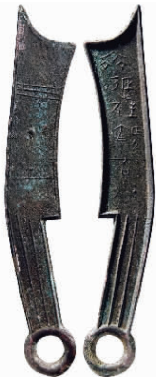
“齐返邦长刀”背“上”六字刀,成交价104.65万元