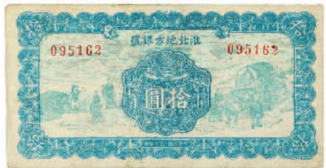
民国三十二年淮北方银号边币蓝色拾圆,成交价24.15万元