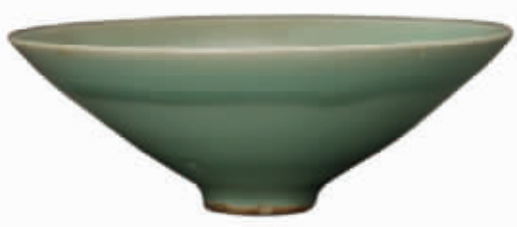
南宋龙泉窑青釉斜直腹斗笠瓷碗