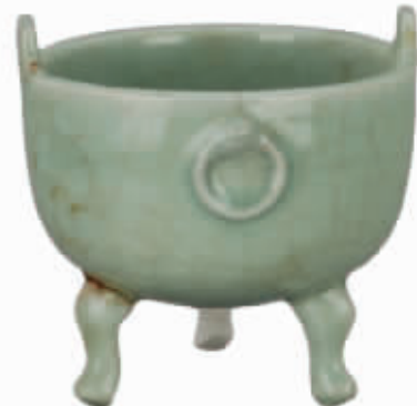
南宋龙泉窑青釉兽耳衔环直口深弧扁鼎式瓷炉