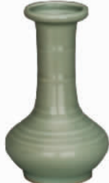
南宋龙泉窑青釉弦纹扁鼓腹长颈盘口小瓷瓶