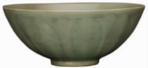
南宋龙泉窑青釉刻花莲瓣纹瓷碗