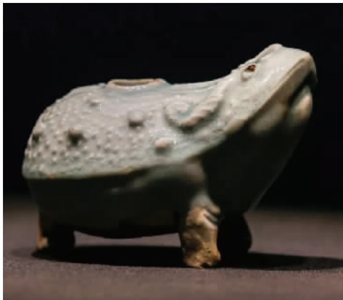
展出南宋景德镇窑青白釉捏塑大口蟾蜍形三足瓷水盂

宋瓷,在中国陶瓷绵延不断的发展史上堪称一个高峰,其以单色釉著称,崇尚素雅,寻求自然意境之美。近日,“湛碧平湖千峰翠色——四川遂宁金鱼村南宋窖藏瓷器精品展”在中国园林博物馆展出。