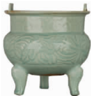
南宋景德镇窑青白釉刻花莲荷纹鼎式炉