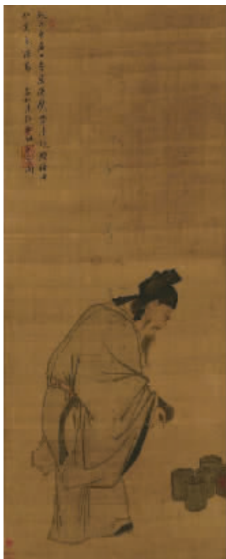
图1 明郭诩《斋居运甃》立轴期间,事务比较清闲,每天清早起床,把数百块砖搬到室外,傍晚又搬回室内,刮风下雨,严寒酷暑,从不间断。有人看见感到奇怪,问他:“为何要这样干?”陶侃答:“恐怕悠闲惯了,将来不能干一番大事。”后来人们用“运甃”表示励志勤力,不畏往复,被历代传为佳话。南齐名相萧崱《养性论》谓陶侃“习劳惜福”。唐代诗人元稹《纪怀赠李六户曹崔二十功曹五十韵》:“运甃调辛苦,闻鸡屡寝兴。”苏轼《送公为游淮南》:

《斋居运甃》,典自《晋书》卷六十六《陶侃传》。晋·裴启撰《裴子语林》:陶侃任广州刺史