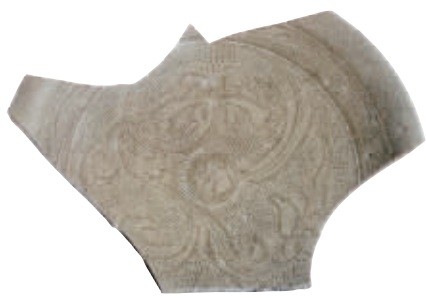
图1 同安窑珠光青瓷,标志性“米”字形荷花纹