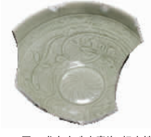
图9 龙泉窑珠光青瓷,标志性“米”字形荷花纹