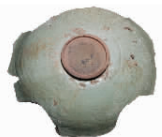
图6 松溪窑珠光青瓷,双面皆主题纹饰“米”字形荷花纹