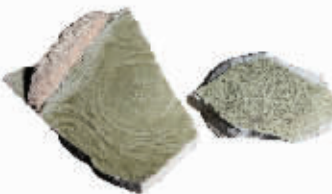
图5 松溪窑“张”“吉”字款珠光青瓷