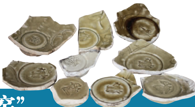
图3 同安窑鹿纹珠光青瓷