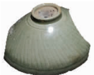
图8 龙泉窑珠光青瓷,外刻线纹