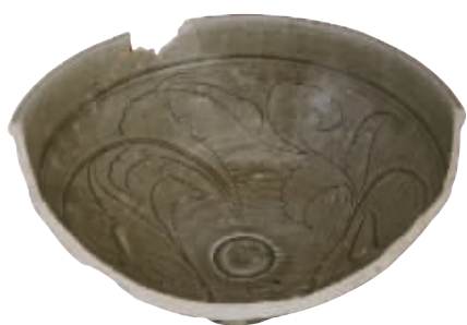
图2 同安窑珠光青瓷,刻划技艺水平极致