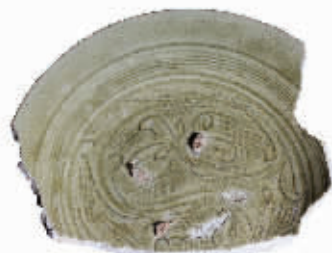
图4 松溪窑珠光青瓷,标志性“米”字形荷花纹

(9)铭文款识。同安窑珠光青瓷鹿纹独尊,松溪窑“吉”“张”字款端坐大盘内底,龙泉窑内底心多饰一朵花。