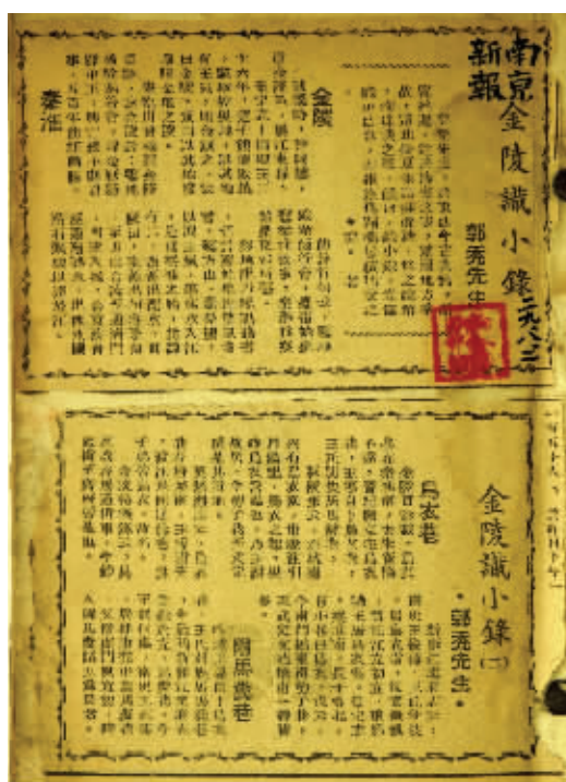
民国剪报《金陵识小录》剪报首页

(1890—1945),字人鹤,福建闽县(即今福建闽侯)人。早年东渡日本,入明治大学、东洋大学,分获法、文学士学位。