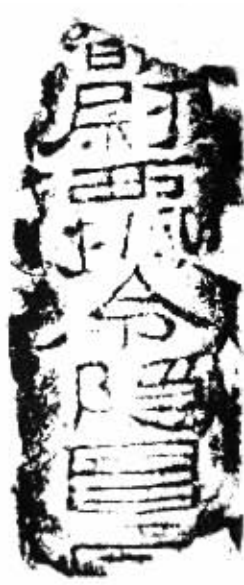
图4 旬尉西城令隐昌