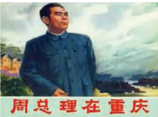
从左到右依次为:《人民的好总理周恩来》(少年儿童出版社)、《春暖梅坞》(浙江人民美术出版社)、《周总理在重庆》(四川民族出版社)