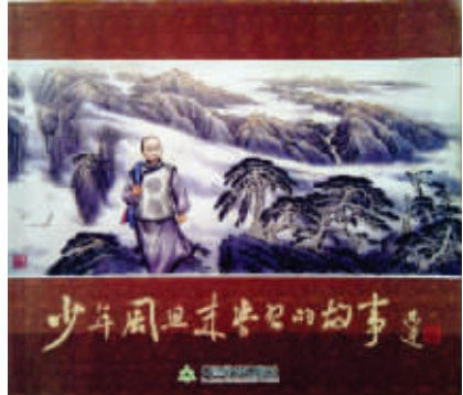
从左到右依次为:《周恩来同志在长征路上》(上海人民美术出版社)、《周恩来画卷》(中国少年儿童出版社)、《周恩来青少年时代》(中国连环画出版社)、《少年周恩来学习的故事》(天津教育出版社)