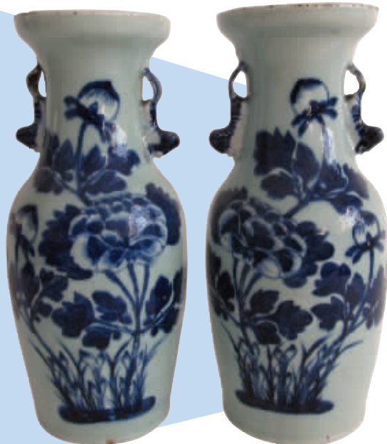
清代牡丹纹花瓶(一对)