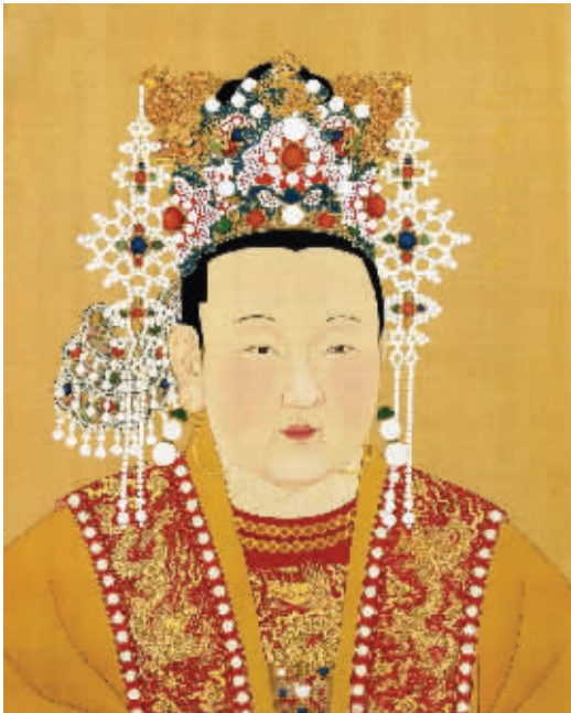
图3 明仁孝文皇后像