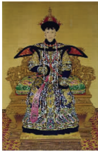
图5 乾隆孝贤纯皇后