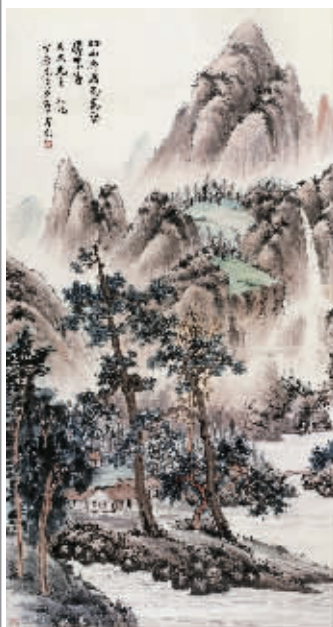
丁念先《万壑松风图》

丁念先(1906—1969),上虞人,原名守棠,字念先,斋号念圣楼(取丁念先与夫人谢圣铺各一字而成),擅长书画,尤精于隶,曾加入海上题襟馆,后从丁辅之、高野侯等人另组古欢今雨社,历任中国画会总干事等职,其“念圣楼”之书画文物与古籍碑帖皮藏量丰质精,殊为可贵。