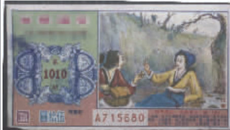
“非己不取”典故彩票