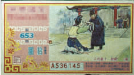
“上书救父”典故彩票