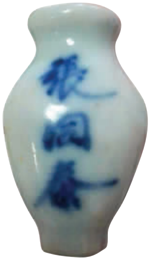
图1 民国青花“松江西门外张同泰”款瓷药瓶