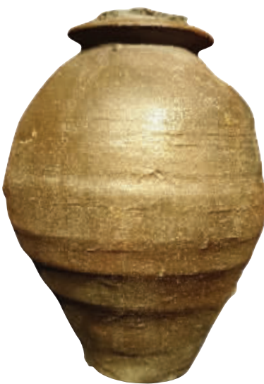
图5 松江老城区旧时府城内云间路出土韩瓶