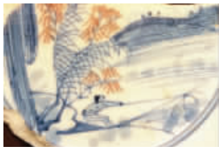
图4-2 松江老城区出土清代康熙年间青花釉里红“捕鱼图”瓷片