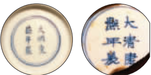
图3 松江老城区出土的清代康熙晚期豆青卧足碗瓷片(仿款) 图4-1 松江老城区出土清代康熙年间青花釉里红“捕鱼图”瓷片

张同泰分号。1944年有松江“南京路”之称的从岳庙到马路桥这段大街,是属于茸城(松江别名)最为繁盛的黄金地带,万商云集,市面兴旺,人们日常生活中吃穿用的一切都能买到。这条大街就是松江华亭老街(松江古称华亭),即从今天的中山中路马路桥(近人民路)至西林路一段,长约600米。“最大的中药铺便是‘余天成’和‘张同泰’,还有几家西药房,那时西医不多,