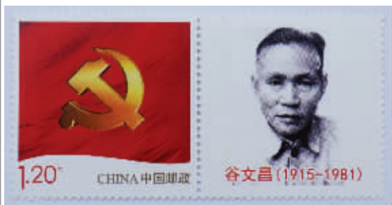
郑锦添设计的纪念谷文昌诞辰100周年个性化邮票