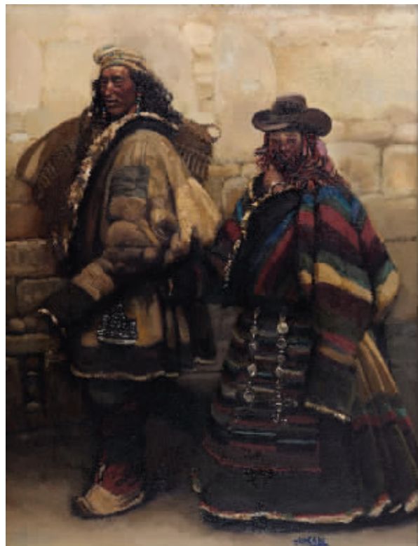
陈丹青《进城》,在中国嘉德2017秋拍中拍得793.5万元