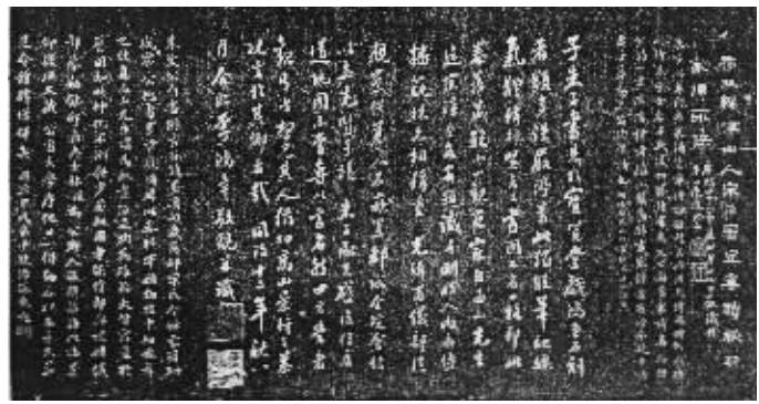
《游云谷诗》书法长卷拓片题跋

清嘉庆进士,任过侍讲学士、通政司副使的鲍桂星(1764-1826),字双五(又字觉生),是歙县岩镇人。鲍桂生疑与鲍桂星同族同辈。旧时,淮阴是徽商经营的一大据点,鲍桂生自称“淮阴鲍桂生”,有极大可能是其先祖因经商而占籍淮阴。