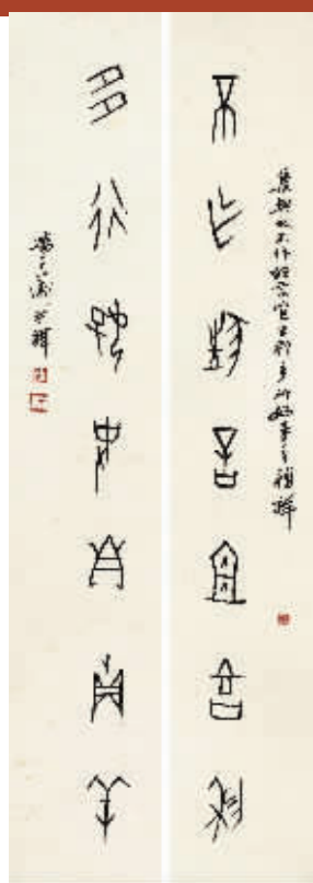
潘主兰甲骨文七言联