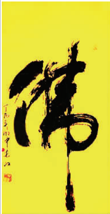
《佛》68 × 136cm