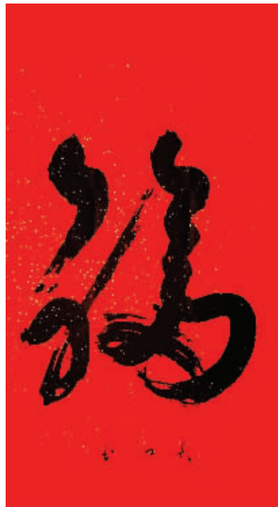
《福》95 × 175cm