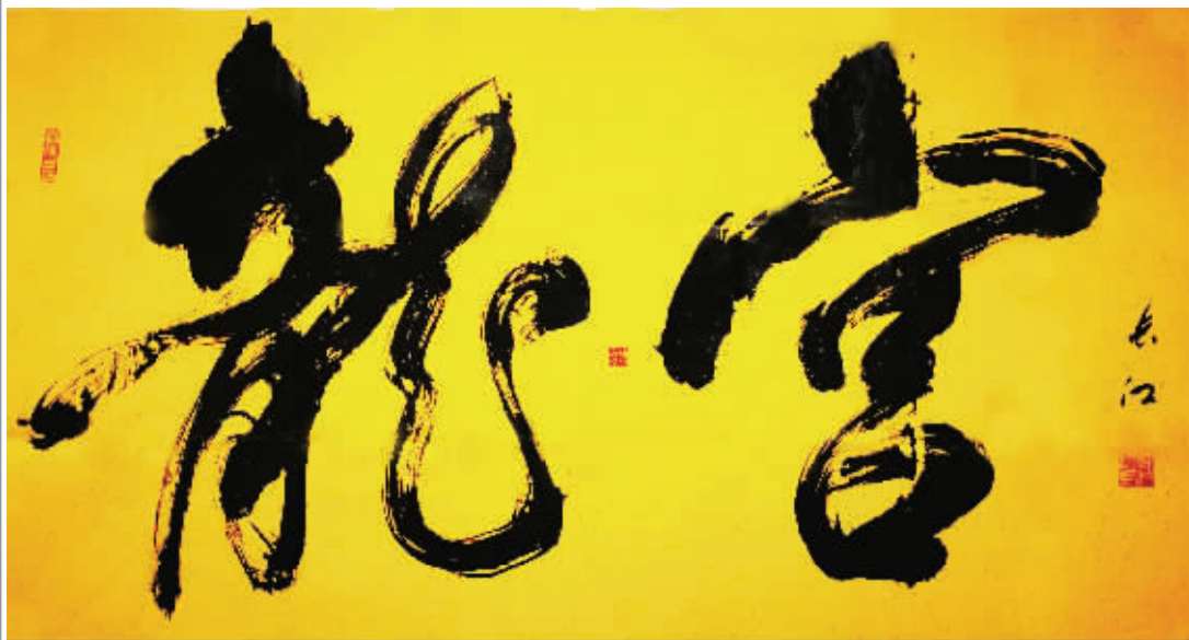
《龙宫》175 × 95cm