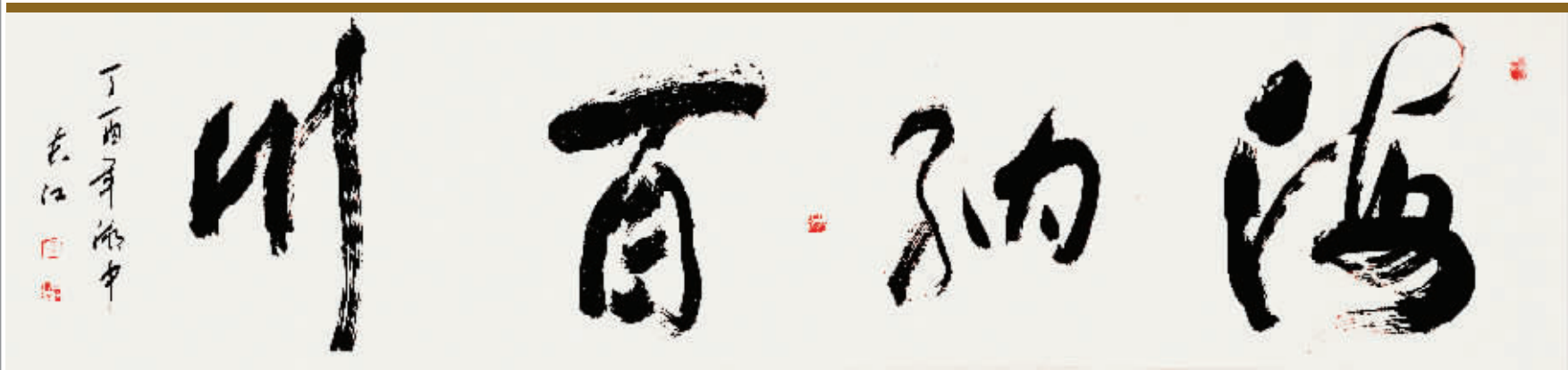
《海纳百川》232 × 53cm