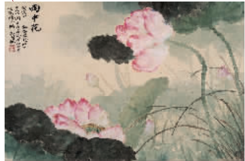
吴湖帆 1938年作《雨中花》

手卷及册页均为书画作品的装裱形式,手卷为横幅长画,欣赏时置于桌上,从右至左,边卷开边看,犹如展开一次互动旅程。册页则将多幅绘画集结,装裱成书本形式。梅洁楼藏画的“方寸之间——梅洁楼藏手卷册页”展览旨在凸显这些艺术形式可以近距离接触的特质,让参观者感受惊喜、兴奋和探索的乐趣。(赖嘉)