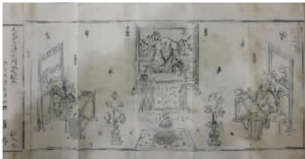
《洪武南藏》六零六五卷一部分