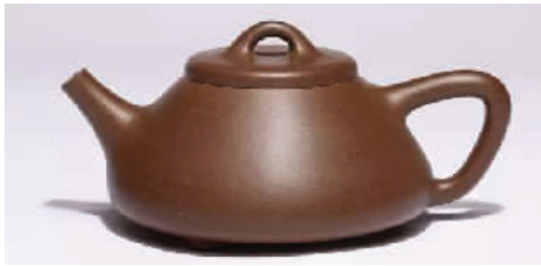
中超利永曾释出一批紫砂壶,图为当年竞买会上的顾景舟合欢壶(上)和子冶石瓢壶(下)

宋清辉表示。中超控股方面表示,协议转让后,上市公司将借助深圳鑫腾华及其关联方的资源,未来将改善上市公司经营状况,提升其综合竞争力,同时在适当时机为上市公司拓展新的实体业务,进一步提高上市公司的资产质量,增强上市公司的持续盈利能力。未来新控股股东将为上市公司拓展什么实体业务目前尚无法知晓,但在中超控股现有业务体