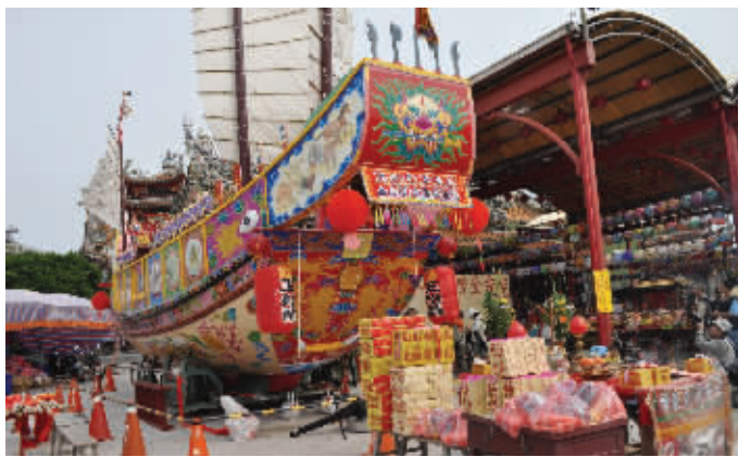
台南北门三寮湾东隆宫三年一科王船祭