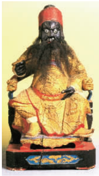
五府千岁之一池府王爷坐像

王爷信仰在台湾相当盛行,涵盖的信仰区域广阔,也因各地社会、产业经济形态而发展出多样的地区特色,并保存了全世界最完整的祭祀仪礼与发展脉络,台湾历史博物馆近日开展“巡狩四方——台湾及东南亚王爷信仰特展”。