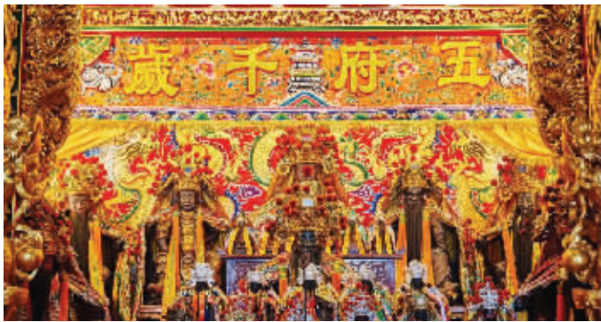
台湾王爷信仰盛行,南厂保安宫一般称为“王宫”,是台南西区规模最大的王爷庙