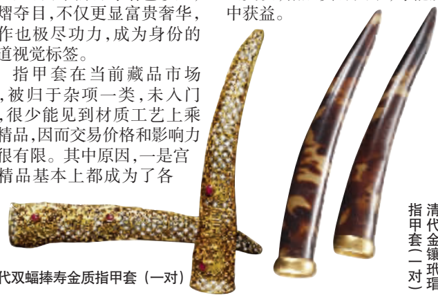
清代双蝠捧寿金质指甲套(一对)

大博物馆的珍藏,二是进行专项系列收藏的人,有自己的小圈子,精品很少进入市场流通。这也要求收藏者不仅要了解行情,同时也要广泛参与实践,与同道交友,拓展资源圈子,才能从中获益。